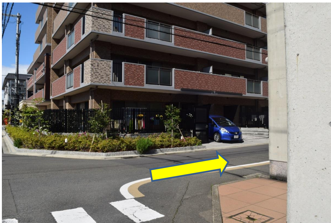
转角上是一幢七层楼的公寓